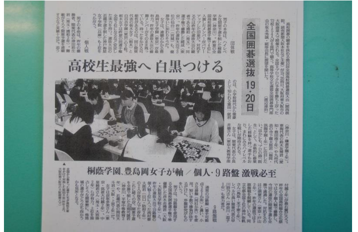
展開を予想する現地の新聞報道