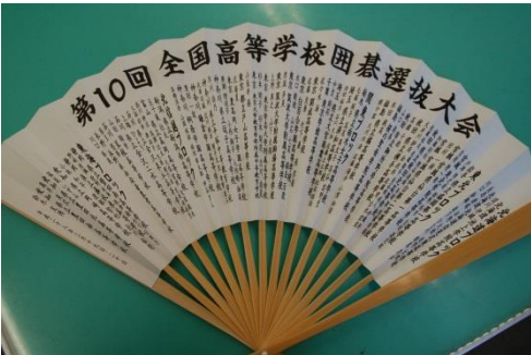
↑ 出場者に配られた記念扇