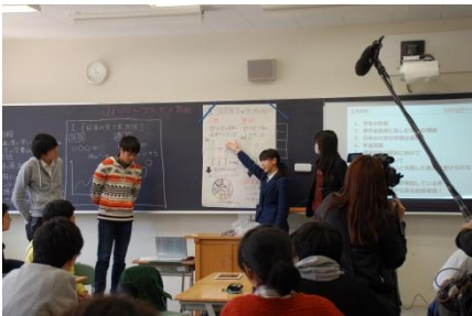
↑ テレビの取材も入りました