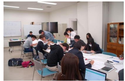
↑ クラスで選ばれた班は 放課後も翌日の準備