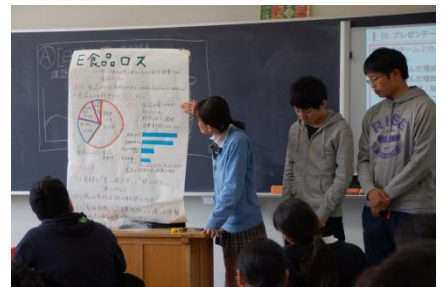
↑ クラスで班毎にプレゼン