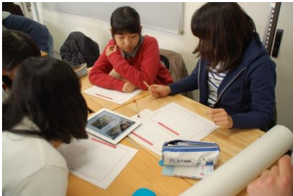
↑ 課題を決め、データを調査

3月22・23日、「社会課題アイデアソン in 戸山高校」と題し、ヤフーのプログラムを活用した主権者教育が2年生を対象に実施されました。新3年生の中には間もなく選挙権を得る生徒もあり、自分たちで社会の問題を見つけ、解決策や対策を提言していく課題に熱心に取り組んでいました。各クラスで選ばれた発表はどれも内容が濃く、戸山生の意識の高さを感じさせるものでした。